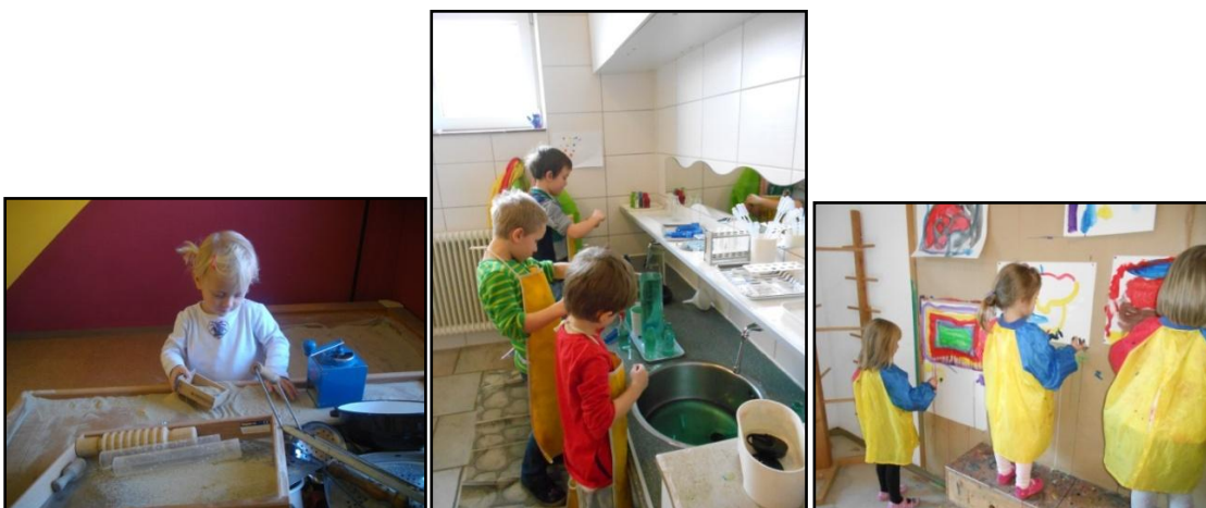
Vielfältigste kreative Möglichkeiten im Kinderhaus