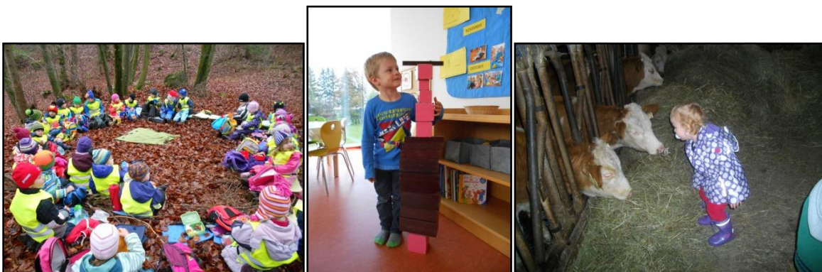
Die vorbereitete Umgebung im und um das Kinderhaus kommt dem natürlichen Interesse und der natürlichen Neugier der Kinder entgegen.