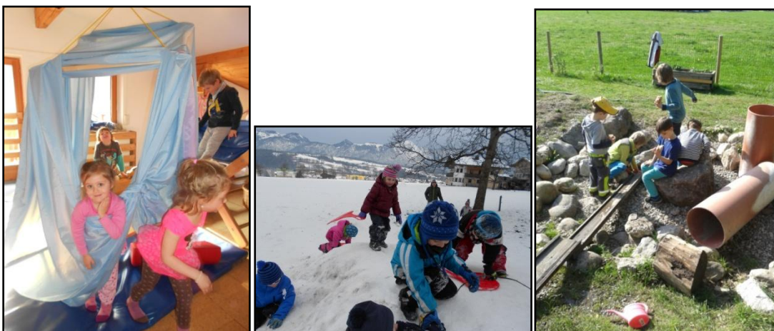
Kinder drücken ihre Lebensfreude und Vitalität in Bewegung aus