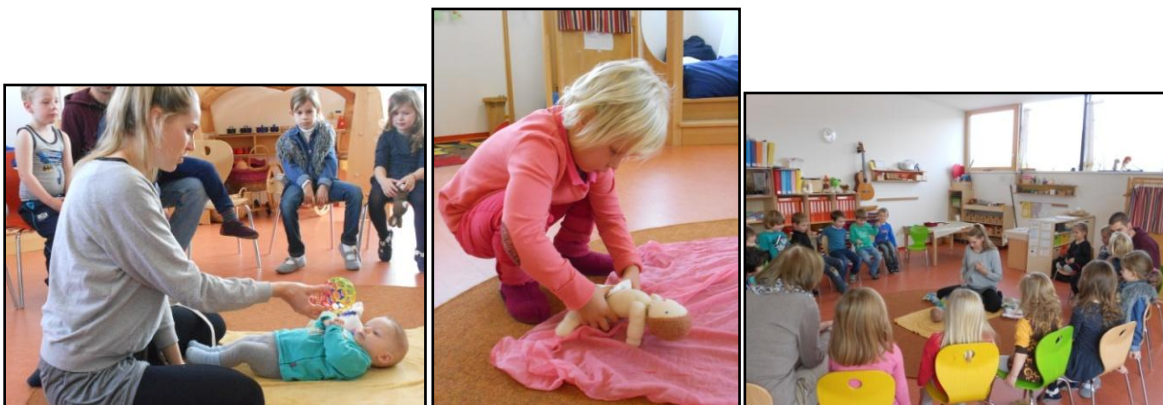
Das Babywatching-Projekt im Kinderhaus fördert die Empathie der Kinder